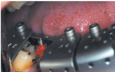
Abformung eines Implantats im Unterkiefer