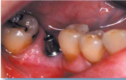
D Aufbauposten auf dem Implantat