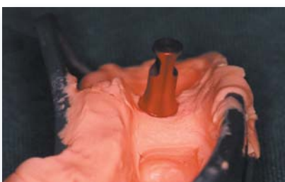
Auf dem Implantat positionierter Abformpfosten