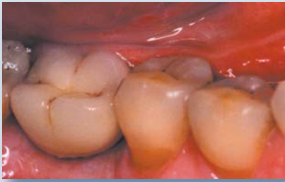
Fertiger Zahnersatz in situ