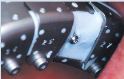
Abformung eines Implantats im Oberkiefer