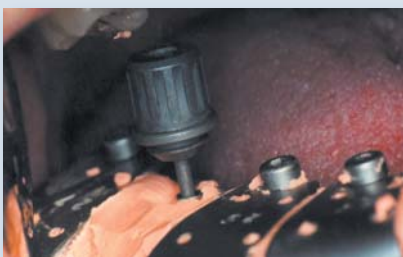
Abdruck im Mund und lösen der Schraube